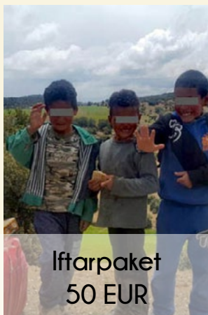
Iftarpaket 50 EUR