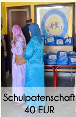
Schulpatenschaft 40 EUR